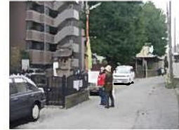
【慈恵稲荷神社】 説明を熱心に聞いていた。