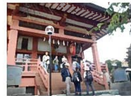
【大善院】 参拝されるお客さま。