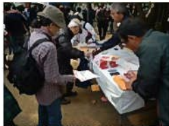
【浦和区民まつり（浦和北公園会場）】 スタンプポイント。ステージイベントを楽しむお客さま。