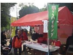
【浦和区民まつり（市場通り・常盤公園会場）】 スタンプポイント。お買物やお昼休憩として利用されていた。