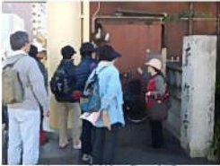
【廓信寺】 解説を聞くお客さま。