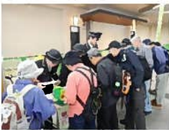
【スタート受付】 注意事項の案内後、受付をスタート。浦和区民まつりのパンフレットも配布。