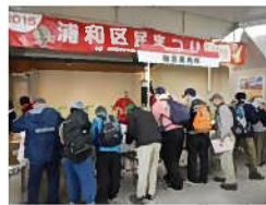
受付横では区民まつりのブースがあり、賑っていた。