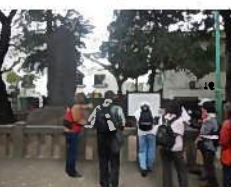
【浦和宿本陣跡】 歴史の説明を聞くお客さま。